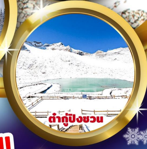
ต่ากู่ปิงชว่น